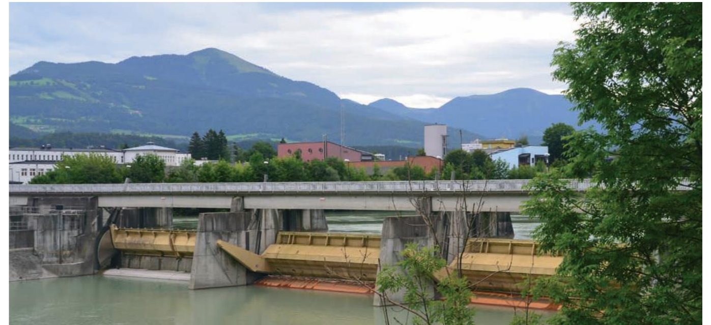
Kraftwerk Sohlstufe Hallein

Der Hochwasserschutz gewinnt durch eine neu angelegte Flutmulde im Bereich des Oberwassers. Im Unterwasser des Kraftwerkes bis zur Neumayr-Brücke wurden über 20 Steinbuhnen angelegt. Diese und die etwa 15 Meter breite Tiefenrinne in der Flussmitte erleichtern den Weitertransport des Geschiebes. Außerdem wurde dadurch die zuvor relativ geradlinige Salzach-Uferlinie besser strukturiert und die Salzach erhielt wieder ökologisch wertvolle Strukturen und Zonen, in denen Jungfische und kleinere Fischarten Unterstände und Lebensraum finden.