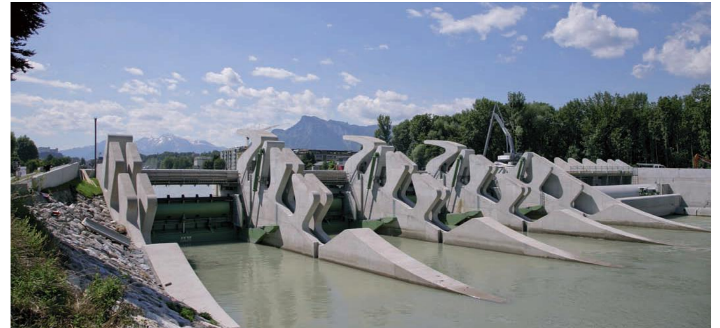
Kraftwerk Sohlstufe Lehen

Mit moderner Architektur und ökologischen Besonderheiten zeichnen sich die Kraftwerke Sohlstufe Lehen und Rott mitten im Ballungsraum Salzburg aus. Zusammen produzieren sie Strom für 31.500 Haushalte.