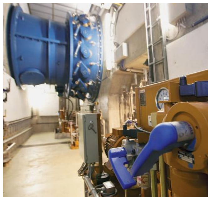
Turbine Kraftwerk Rott

Im Rahmen eines Wettbewerbes setzte sich der Entwurf der Architekten Erich Wagner und Max Rieder durch. Das Kraftwerk Sohlstufe Lehen mit seinen markanten Betonschnäbeln auf den Wehrpfeilern und dem Krafthaus auf der linken Salzachseite liegt auf Höhe des Glanspitzes zwischen Lehen/Liefering und Itzling.