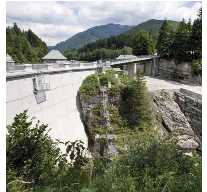
Kraftwerk Wiestal – Wiestalsperre