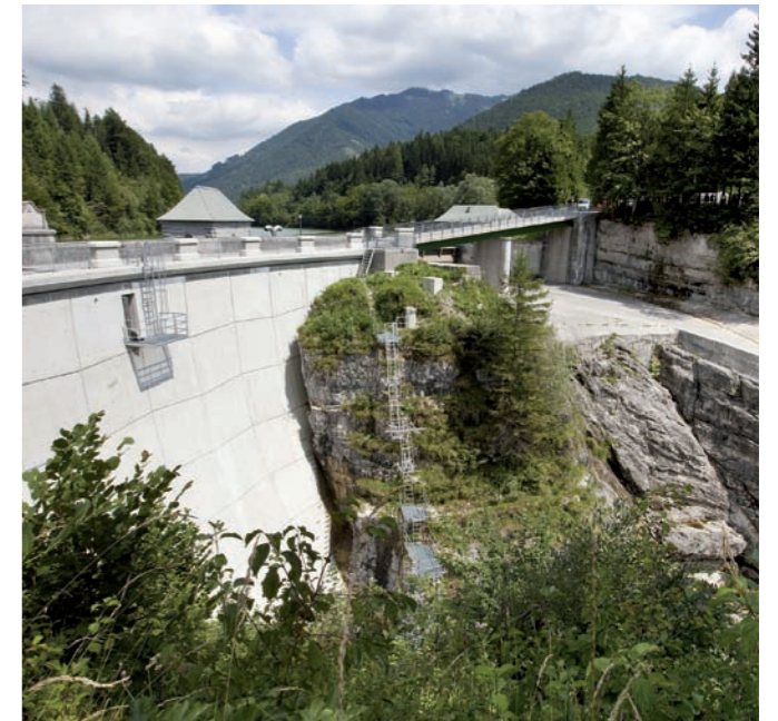
Kraftwerk Wiestal – Wiestalsperre