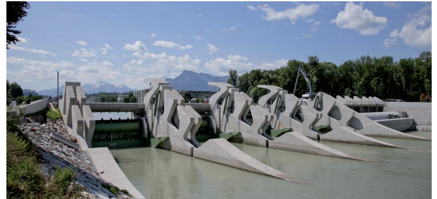
Kraftwerk Sohlstufe Lehen

Im Zuge des Neubaus entstand eine moderne Fischwanderhilfe mit Schlitzpässen, durch welche die Saalach an dieser Stelle wieder durchgängig wurde. In das Bauprojekt flossen in Summe 20 Millionen Euro, was einen kräftigen Impuls für Umwelt und Wirtschaft darstellte.