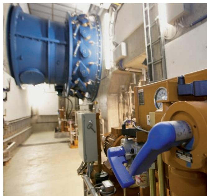
Turbine Kraftwerk Rott

Im Rahmen eines Wettbewerbes setzte sich der Entwurf der Architekten Erich Wagner und Max Rieder durch. Das Kraftwerk Sohlstufe Lehen mit seinen markanten Betonschnäbeln auf den Wehrpfeilern und dem Krafthaus auf der linken Salzachseite liegt auf Höhe des Glanspitzes zwischen Lehen/Liefering und Itzling.